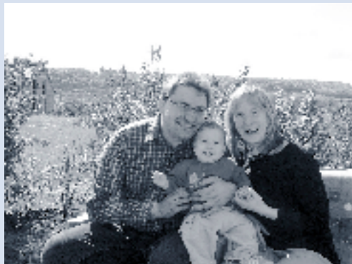
In the garden with the family Im Garten mit der Familie